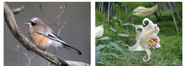
(写真左：都民の森の野鳥”カケス”（留鳥） / 右：都民の森に群生するヤマユリ)

200 ヘクタールの広大な都民の森の約半分がブナの森です。そこから吹き下ろす爽やかな風と、アコーディオンが奏でる風の音楽、これらが一つになって素敵な森のコンサートにという思いが込められています。そして地球環境を守るブナ林に、より関心が寄せられることを願っています。