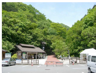
(写真: 都民の森入口付近)

店など)の他、宮地楽器(小金井、青梅、あきる野など多摩方面のお店)にポスター、チラシなどが展示され、これから宣伝が始まります。